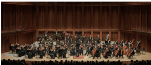
兵庫芸術文化センター管弦楽団 Hyogo Performing Arts Center Orchestra

2005年9月設立。阪神・淡路大震災からの復興のシンボルとしてオープンした兵庫県立芸術文化センターの専属楽団。芸術監督は佐渡裕。世界中でオーディションを行い、多国籍の若手奏者により編成されアカデミーの要素も持つ。同センターを拠点に多彩な活動を展開。2006年関西西元気文化圏賞ニューパワー賞、2011年神戸新聞平和賞、2017年ミュージック・ペンクラブ賞受賞。 https://hpac-orc.jp