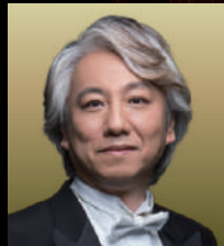
テノール / 小原啓楼 Keiro Ohara